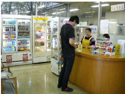
明るい表情で接客作業にはげむ

平成 18 年 10 月、SRC 内の売店運営を開始。形式は市作連受託ではありますが、作業に参加していたひとつの作業所が運営の主体となり、他の作業所等の障害者も含め販売、接客を行う体験の新たな広がりとなり、多種多様な仕事（職域）への発展となっていきました。