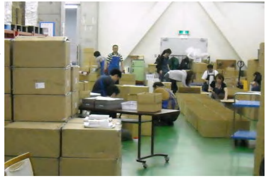
一般の作業員と現場で箱づくり作業を行う

仕事の受注は、支援員を窓口とし、作業工程や数量の把握を確実なものとししました。この窓口役の支援員が取りまとめていたことが、後々までもよかった点であり、企業からの受注体制が、確立されていきました。