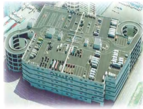
川崎市川崎区東扇島 15