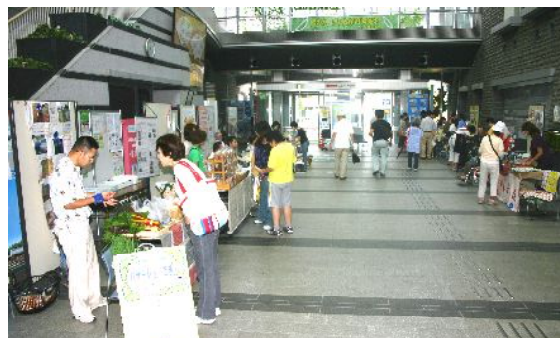
入り口の通路に沿って出店をする

多摩区役所保健福祉センター 地域保健福祉課内 川崎市多摩区登戸 1775-1 Tel.044-935-3267