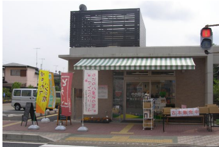
秦野駅から徒歩 10 分

自主製品等の販売 障害者の就労支援 障害者施設の運営相談 共同受注及び販路開拓 障害者に関する情報提供 研修事業等